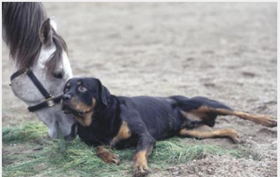
Hugo ja Yasser: Hugo ja Yasser olivat ylimmät ystävä.