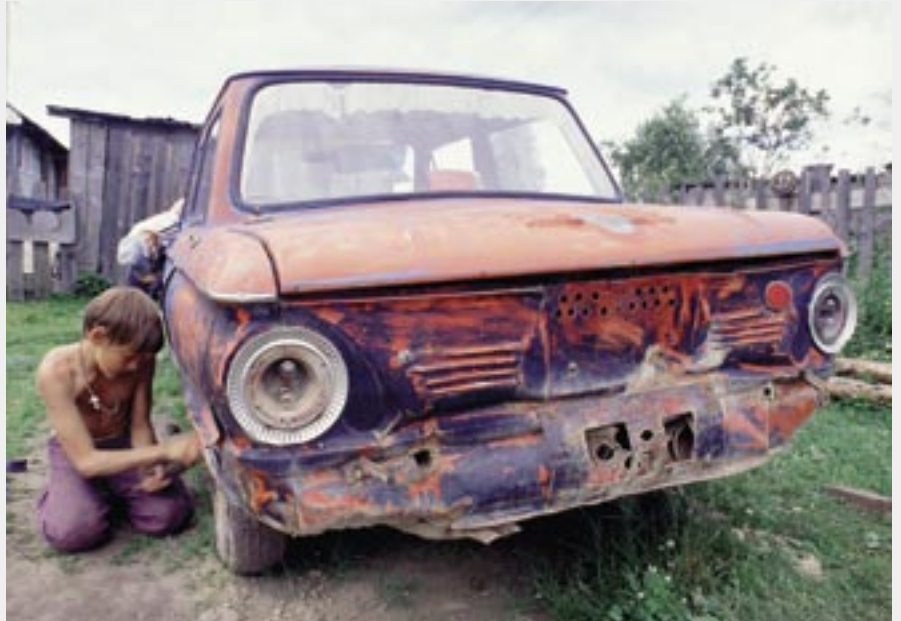
Kiinnostuksen kohteet ovat samat kaikkialla maailmassa – autojen tuunaus. Tämän aherruksen Ilkka Jaakola kuvasi yhdellä monista Vejänelle suuntautuneista kuvausmatkoistaan.